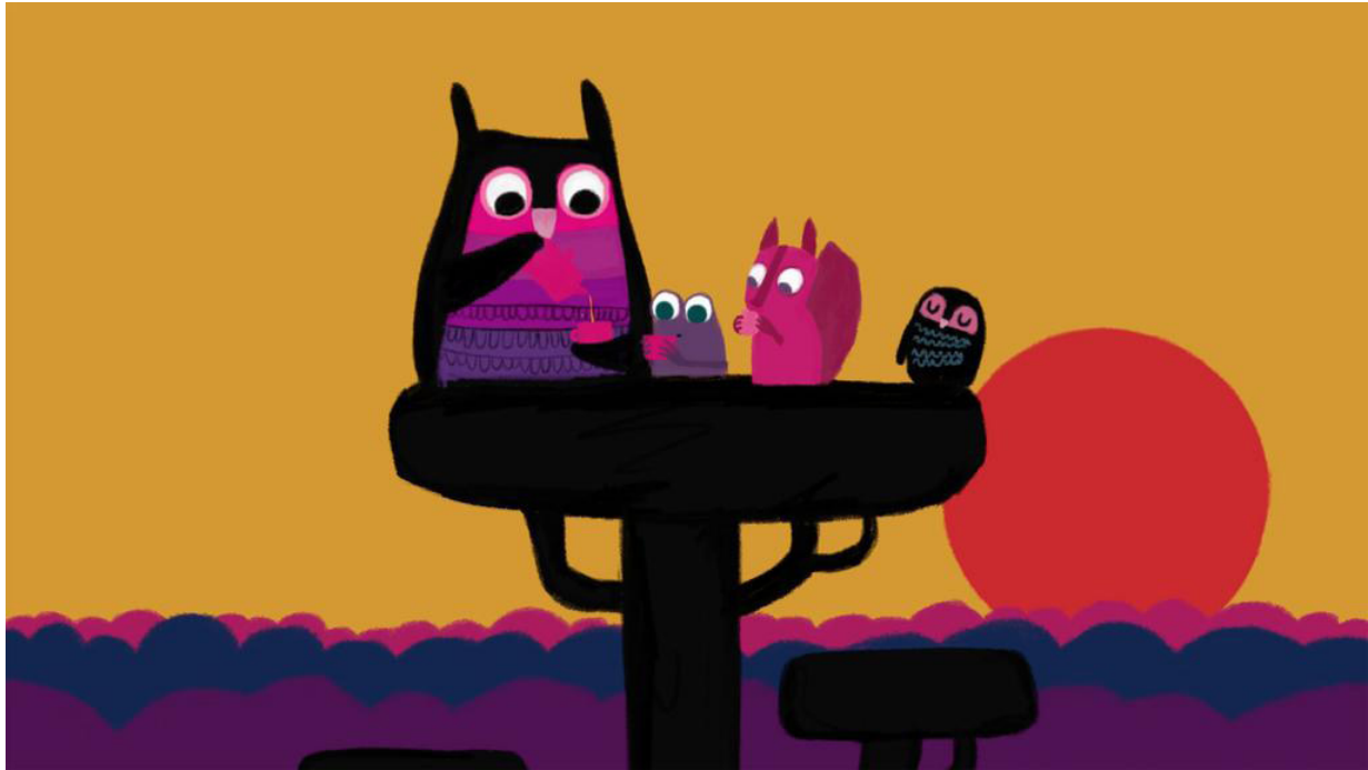
UN PEU PERDU , Hélène Ducrocq